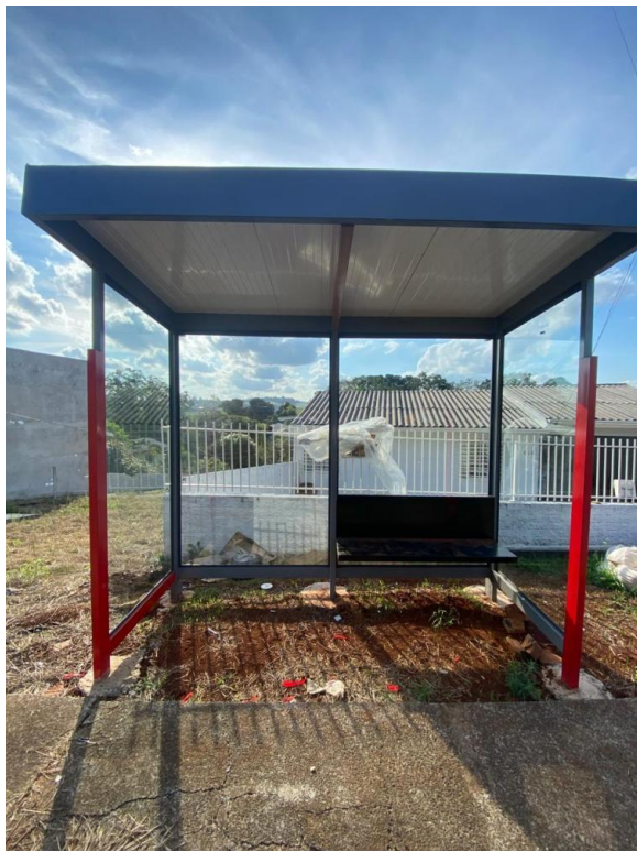
Rua Lupicínio Rodrigues, nº 649 - Bairro Morumbi.