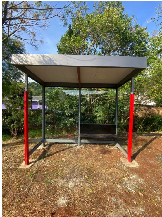
Rua Altamira, nº 930 - Bairro Bonatto.