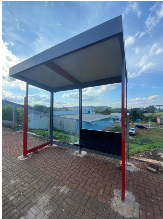
Rua Marília, nº 843 - Bairro São Roque.