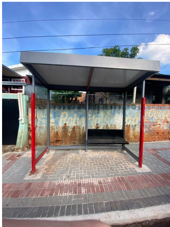
Rua Ivai, nº 1053 - Bairro Jardim Floresta.