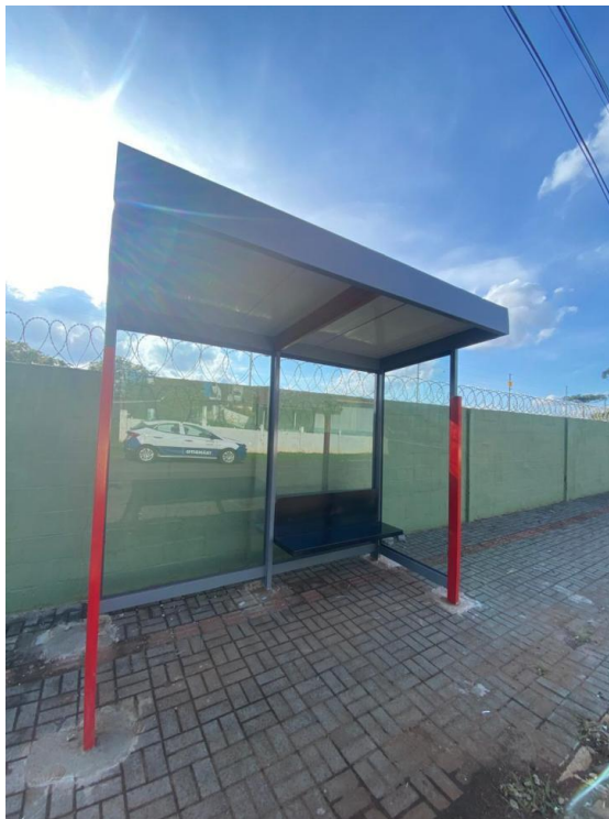
Rua Willibat, nº 43 - Bairro Morumbi.