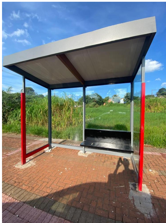
Rua Terezinha Duarte, nº S/N - Bairro São Roque.