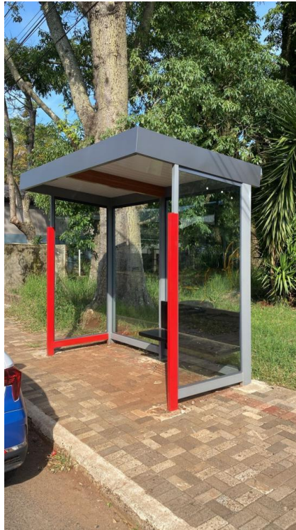
Rua Industrial, nº 177 - Bairro Industrial.

Foi efetuada a vistoria da obra, a fim de realizar a primeira medição, constatando a execução dos itens existentes na planilha de medição. Seguem fotos da obra: