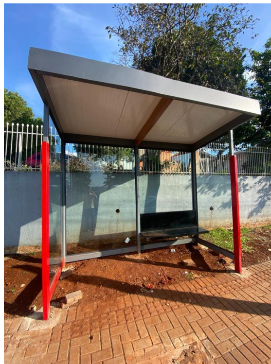
Rua Amambai, nº 275 - Bairro Pinheirinho.