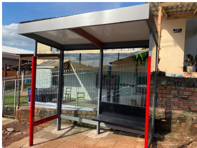
Rua Santa Fé, nº 149 - Bairro Industrial.