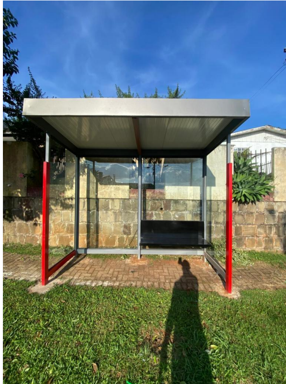
Rua Iguatemi, nº 202 - Bairro Pinheirinho.

Conforme ATA, a contratada deverá garantir a qualidade dos serviços prestados. Se, durante o recebimento definitivo, for constatado que os materiais foram entregues de forma incompleta, com qualidade e quantidade inferior à contratada, apresentando defeitos ou em desacordo com as especificações da aquisição, a Contratada se obriga a substituir os bens em desacordo ou entregar os bens remanescentes às suas expensas, após a notificação da Contratada, sendo interrompido o prazo de recebimento definitivo até que seja sanada a situação. A Contratada deverá reparar, corrigir, remover, reconstituir ou substituir, às suas expensas, os materiais que forem rejeitados, parcial ou totalmente, por apresentarem vícios, defeitos ou incorreções, em um prazo máximo de 10 (dez) dias .