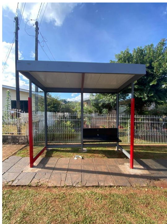
Rua Anchieta, nº 769 - Bairro São Vicente.