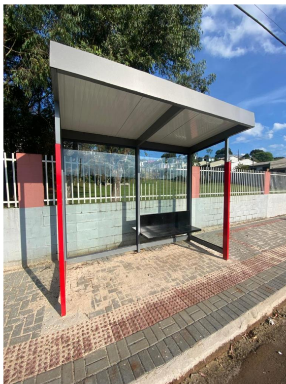
Rua Ivai, nº 1250 - Bairro Jardim Floresta.