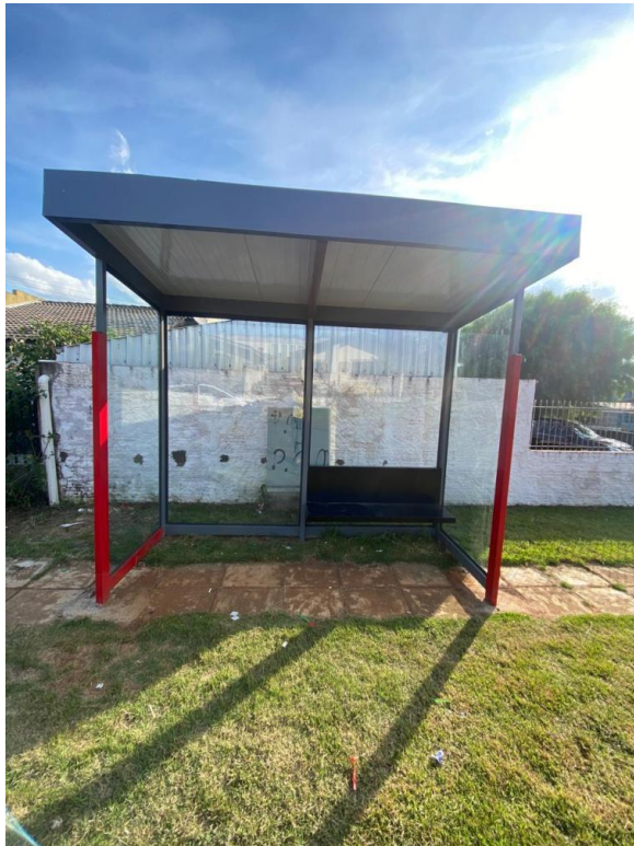
Rua Lupicínio Rodrigues, nº 160 - Bairro Morumbi.