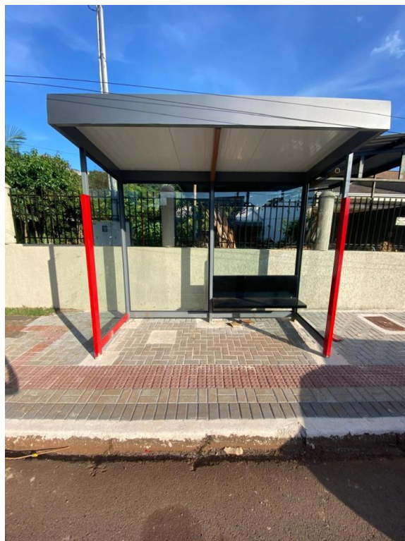
Rua Ivai, nº 677 - Bairro Pinheirinho.