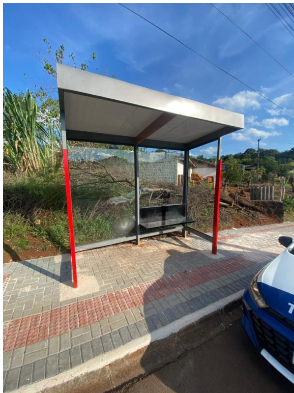
Rua Ivai, nº 1580 - Bairro Jardim Floresta.