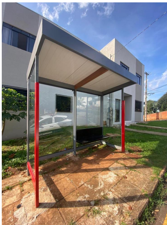
Rua Dr Francisco Beltrão, nº 1083 - Bairro Industrial.