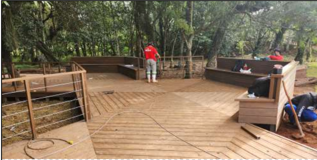
4 | deck de madeira plastica