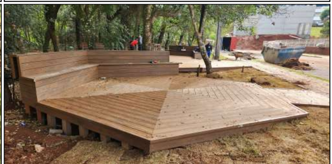
9 | deck de madeira plastica, plantio de grama, instalação elétricas