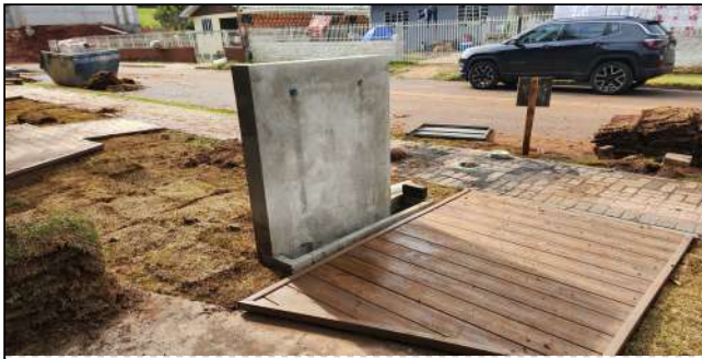
10 | deck de madeira plastica, plantio de grama, instalação elétrica, bebedouro, ligação do esgoto