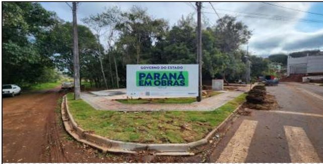
12 | plantio de grama