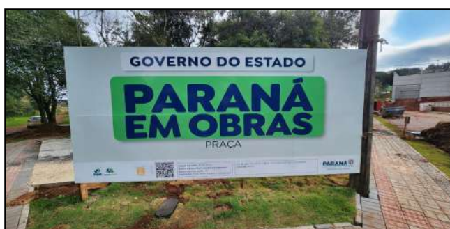
13 | Placa de obra