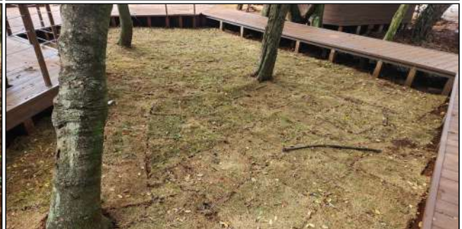
7 | plantio de grama