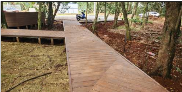
6 | deck de madeira plastica, plantio de grama, instalação elétricas