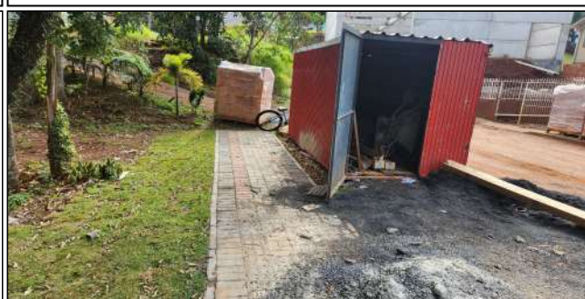
1 | container, plantio de grama