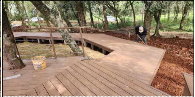
5 | deck de madeira plastica, plantio de grama, instalação elétricas