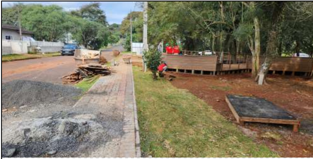
2 | deck de madeira plastica, plantio de grama