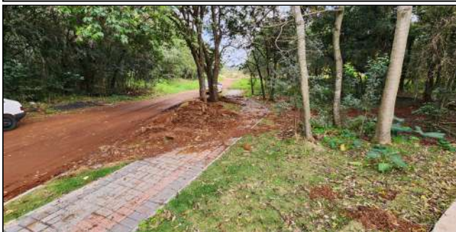
16 | plantio de grama

Versão digital: https://portaldosmunicipios.pr.gov.br/projeto-medicao/15282/lote/19330/medicao/10662/relatorio-fotografico/291