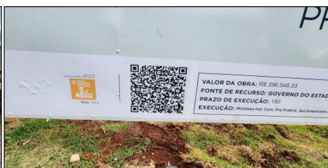
14 | Detalhe da placa de obra