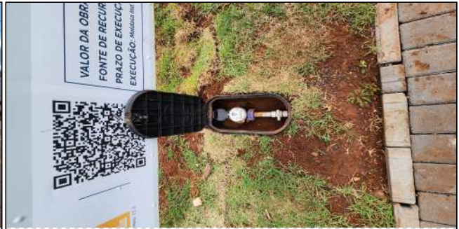
15 | entrada de água