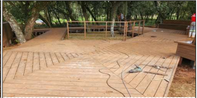
3 | deck de madeira plastica, plantio de grama