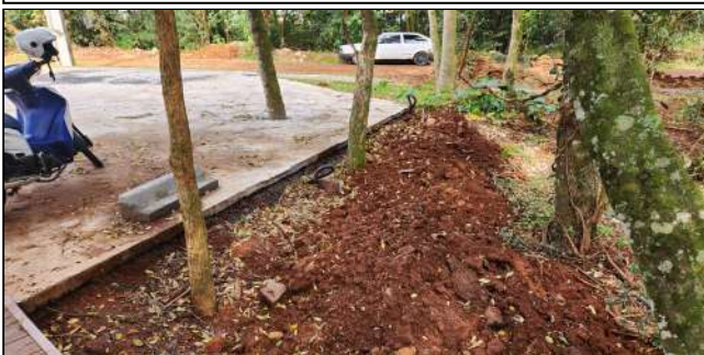
8 | instalações elétricas