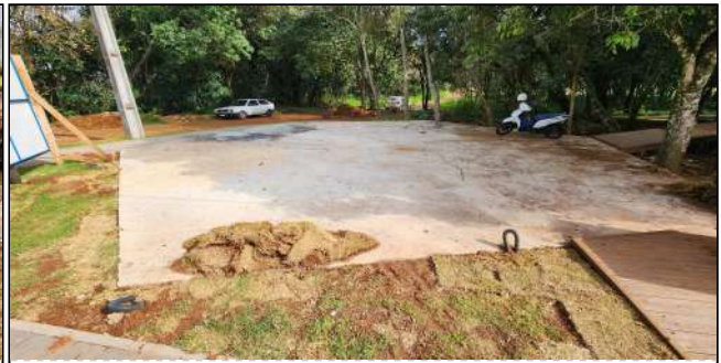
11 | plantio de grama, instalação elétricas