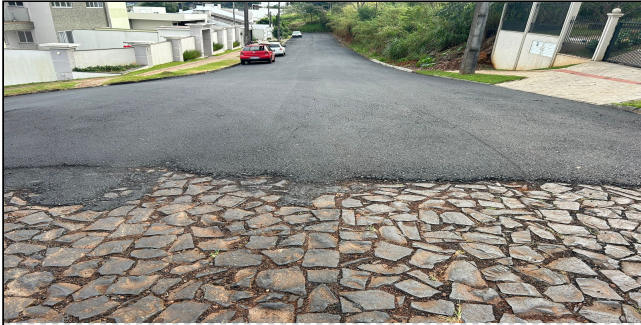
6 | SERVIÇOS EXECUTADOS: TERRAPLENAGEM, PAVIMENTAÇÃO, LIMPEZA E DESOBSTRUÇÃO DE BUEIROS - Rua José Catani