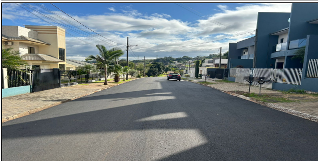
7 | SERVIÇOS EXECUTADOS: TERRAPLENAGEM, PAVIMENTAÇÃO - Rua das Oliveiras