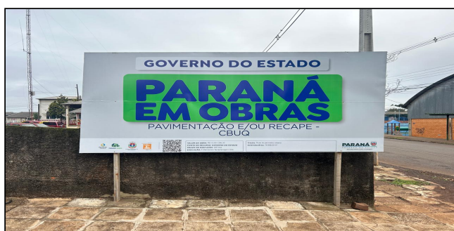
5 | Placa da Obra