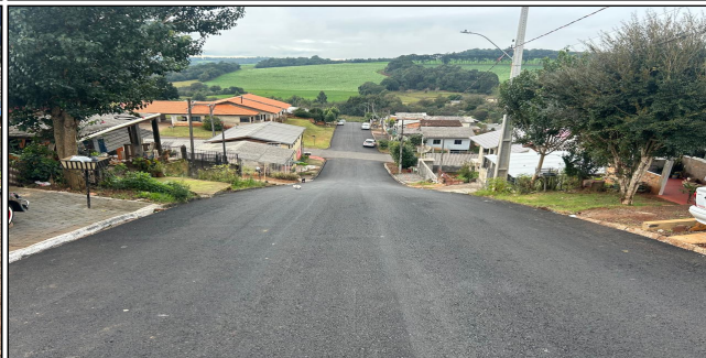
4 | SERVIÇOS EXECUTADOS: TERRAPLENAGEM, BASE E SUB-BASE, PAVIMENTAÇÃO, LIMPEZA E EXECUÇÃO DE GALERIA PLUVIAL - Rua Papa João XXIII