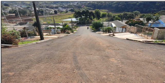
3 | SERVIÇOS EXECUTADOS: REMOÇÃO DE PAVIMENTO ANTIGO, TERRAPLENAGEM, BASE E SUB-BASE, PAVIMENTAÇÃO, LIMPEZA E EXECUÇÃO DE GALERIA