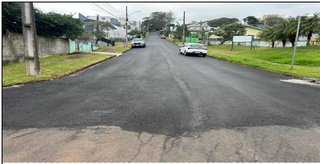
9 | SERVIÇOS EXECUTADOS: TERRAPLENAGEM, PAVIMENTAÇÃO - Rua Nereu Ramos

Versão digital: https://portaldosmunicipios.pr.gov.br/projeto-medicao/15829/lote/19526/medicao/10798/relatorio-fotografico/413