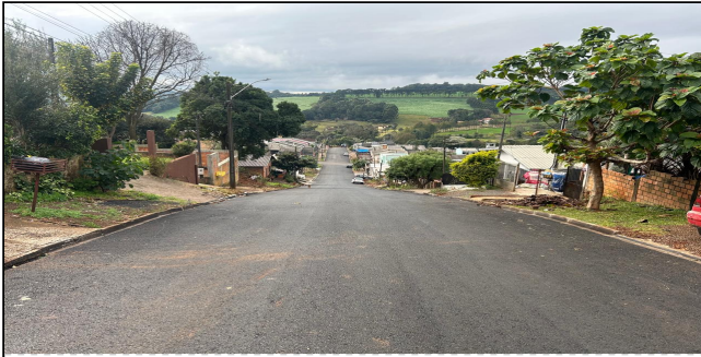
5 | SERVIÇOS EXECUTADOS: TERRAPLENAGEM, BASE E SUB-BASE, PAVIMENTAÇÃO, LIMPEZA E EXECUÇÃO DE GALERIA PLUVIAL - Rua Tomé de Souza