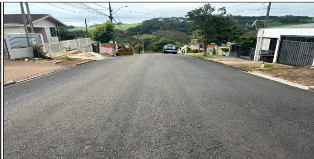
5 | SERVIÇOS EXECUTADOS: TERRAPLENAGEM, BASE E SUB-BASE, PAVIMENTAÇÃO, LIMPEZA E EXECUÇÃO DE GALERIA PLUVIAL - Rua Tomé de Souza