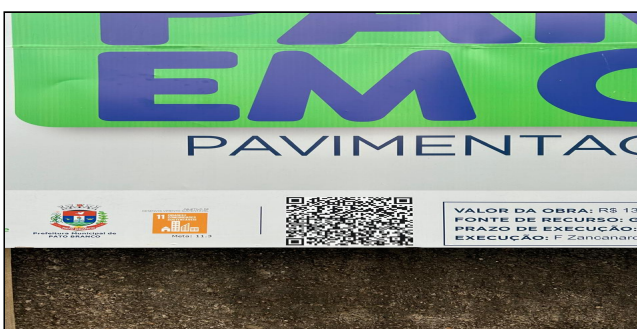
5 | Detalhe placa