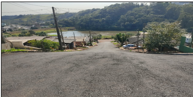
1 | SERVIÇOS EXECUTADOS: TERRAPLENAGEM, BASE E SUB-BASE, PAVIMENTAÇÃO, LIMPEZA E DESOBSTRUÇÃO DE BUEIROS -Rua Artibano Pícolo