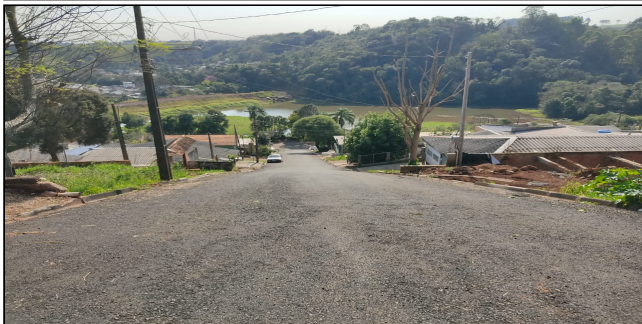
2 | SERVIÇOS EXECUTADOS: TERRAPLENAGEM, BASE E SUB-BASE, PAVIMENTAÇÃO, LIMPEZA E EXECUÇÃO DE GALERIA DE DRENAGEM PLUVIAL - Rua Bento Gonçalves