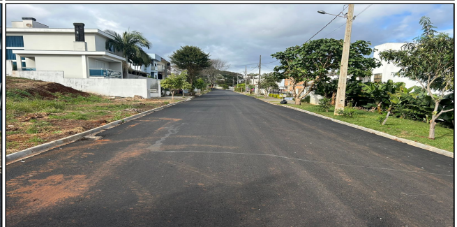
8 | SERVIÇOS EXECUTADOS: TERRAPLENAGEM, PAVIMENTAÇÃO - Rua Antônio Consentino