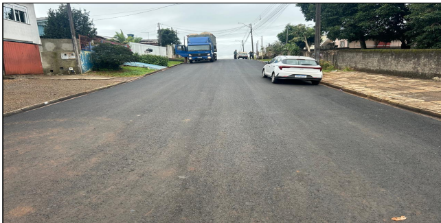
4 | SERVIÇOS EXECUTADOS: TERRAPLENAGEM, BASE E SUB-BASE, PAVIMENTAÇÃO, LIMPEZA E EXECUÇÃO DE GALERIA PLUVIAL - Rua Papa João XXIII