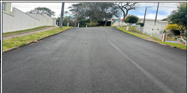
9 | SERVIÇOS EXECUTADOS: TERRAPLENAGEM, PAVIMENTAÇÃO - Rua Nereu Ramos