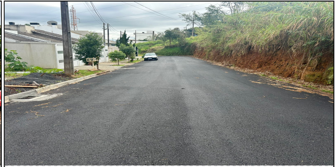
6 | SERVIÇOS EXECUTADOS: TERRAPLENAGEM, PAVIMENTAÇÃO, LIMPEZA E DESOBSTRUÇÃO DE BUEIROS - Rua José Catani