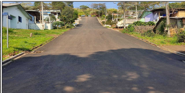
3 | SERVIÇOS EXECUTADOS: REMOÇÃO DE PAVIMENTO ANTIGO, TERRAPLENAGEM, BASE E SUB-BASE, PAVIMENTAÇÃO, LIMPEZA E EXECUÇÃO DE GALERIA