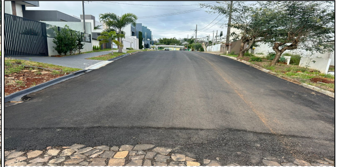
7 | SERVIÇOS EXECUTADOS: TERRAPLENAGEM, PAVIMENTAÇÃO - Rua das Oliveiras