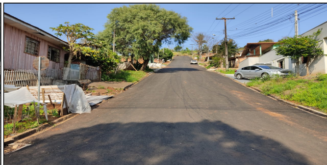
2 | SERVIÇOS EXECUTADOS: TERRAPLENAGEM, BASE E SUB-BASE, PAVIMENTAÇÃO, LIMPEZA E EXECUÇÃO DE GALERIA DE DRENAGEM PLUVIAL - Rua Bento Gonçalves