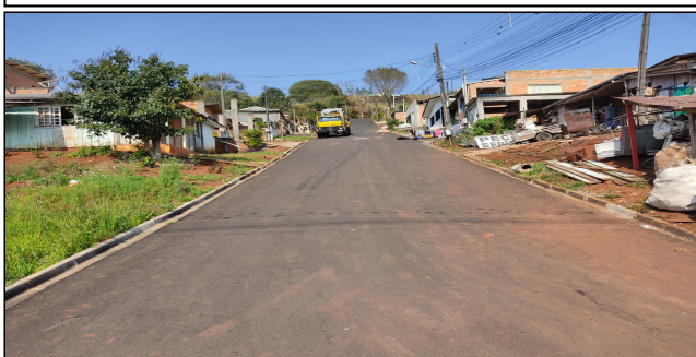
1 | SERVIÇOS EXECUTADOS: TERRAPLENAGEM, BASE E SUB-BASE, PAVIMENTAÇÃO, LIMPEZA E DESOBSTRUÇÃO DE BUEIROS - Rua Artibano Pícolo