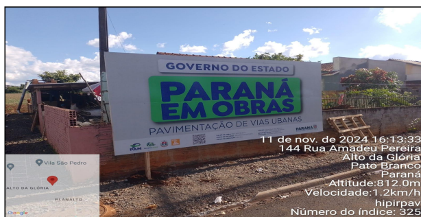
1 | Placa da Obra