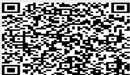
2 | QR Code - Placa de Obra

Versão digital: https://portaldosmunicipios.pr.gov.br/projeto-medicao/16361/lote/20347/medicao/11285/relatorio-fotografico/3545