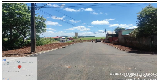
3 | Pavimentação Rua Lauro Ferreira Albuquerque