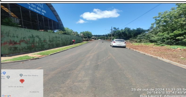
4 | Pavimentação Rua Lauro Ferreira Albuquerque