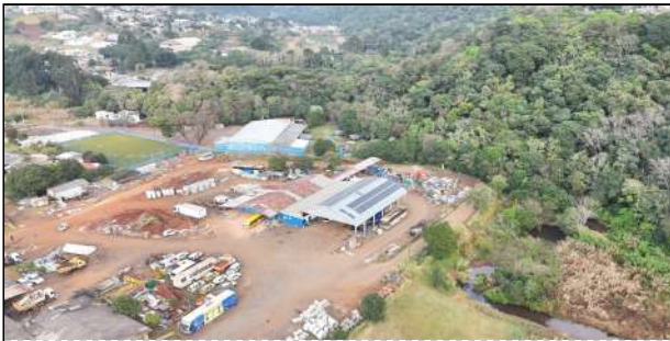
10 | Garagem