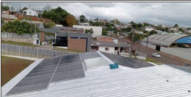
17 | UBS