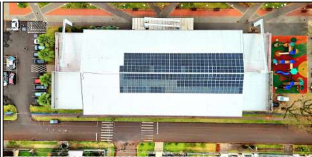
11 | Pista de Atletismo