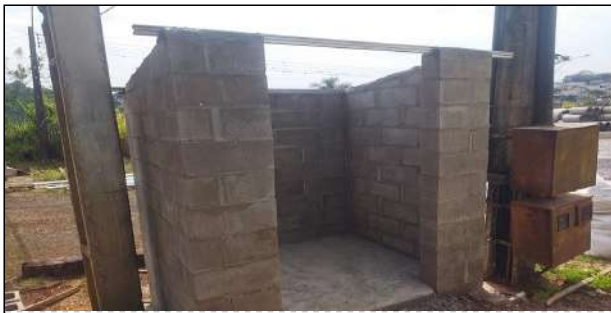
4 | Garagem