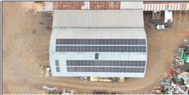
9 | Garagem