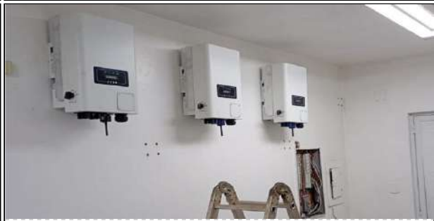
13 | Inversores 01