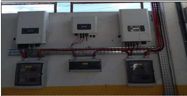
15 | Inversores 02