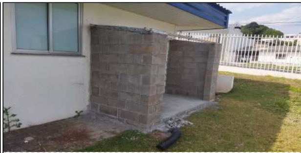
6 | UBS