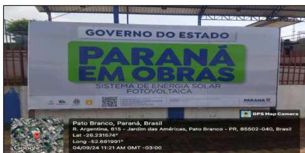
1 | Placa de Obra