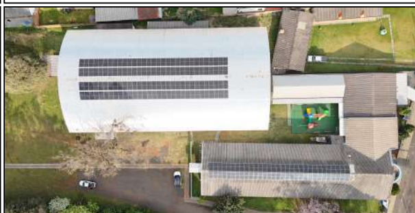
4 | Escola Olavo Bilac