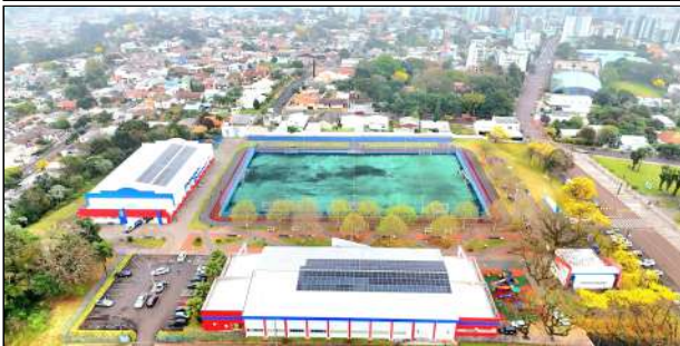
13 | Pista de Atletismo