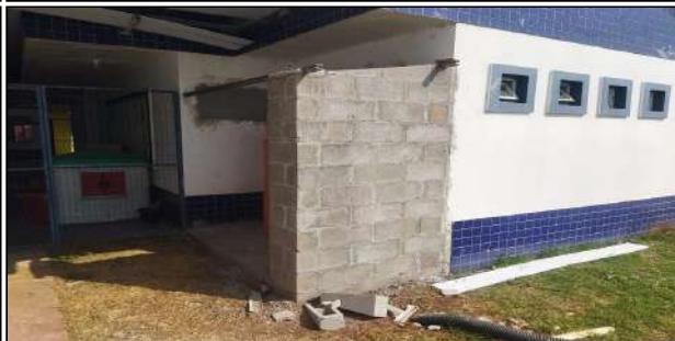
2 | CMEI Alvorada