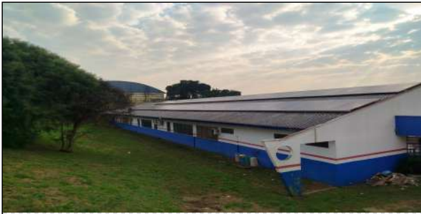
6 | Escola Sao Cristovao