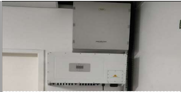
10 | UBS