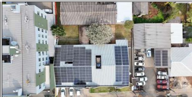
15 | UBS