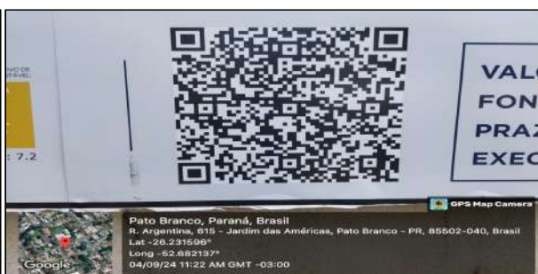
1 | QR Code