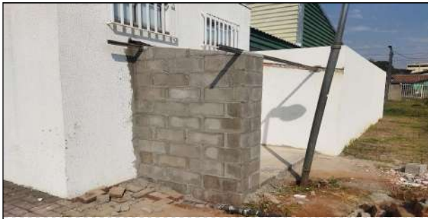
9 | UBS