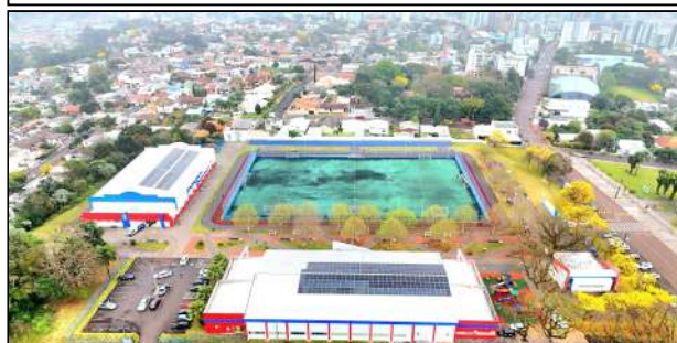
2 | Centro Aquático e Pista de Atletismo