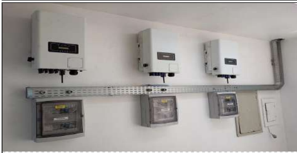
11 | UBS