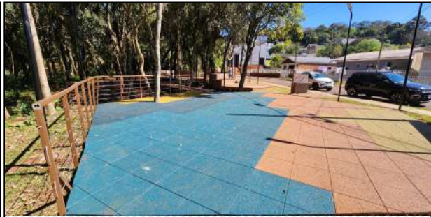
5 | piso emborrachado, guarda-corpo