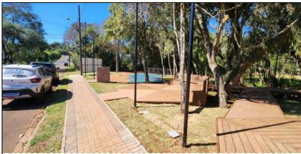
12 | deck e guarda-corpo de madeira plástica, grama, iluminação