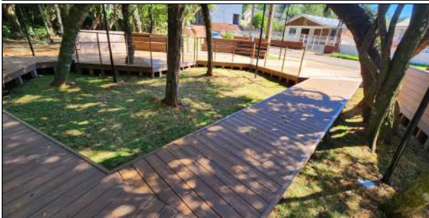
8 | deck de madeira plástica, grama, iluminação