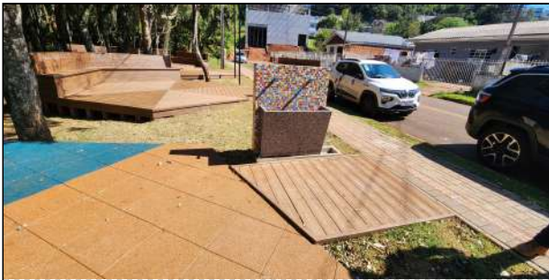
6 | piso emborrachado, bebedouro