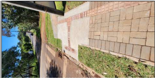
15 | rampa de acessibilidade