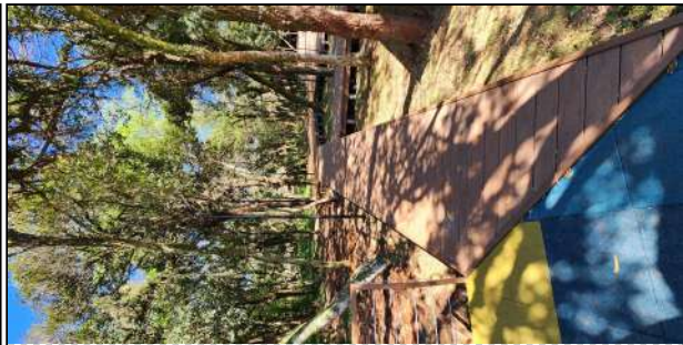
7 | deck de madeira plástica, grama, iluminação