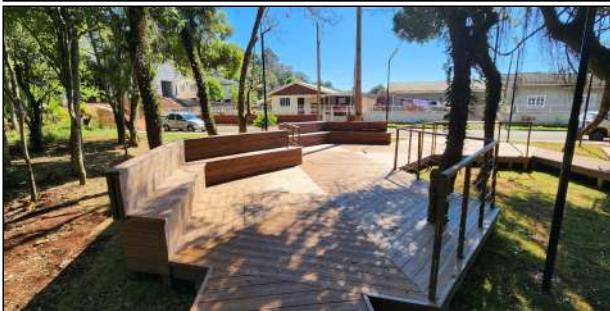
10 | deck e guarda-corpo de madeira plástica, grama, iluminação