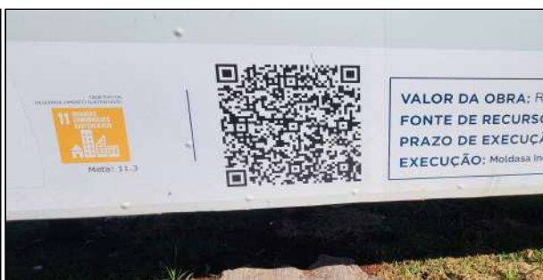
2 | Detalhe da placa de obra