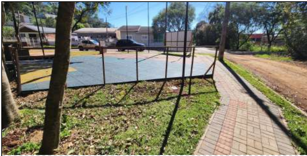
4 | paver, grama, piso emborrachado, guarda-corpo