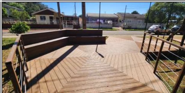
11 | deck e guarda-corpo de madeira plástica