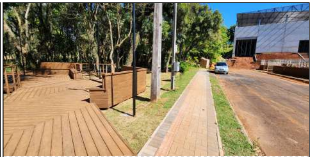
13 | deck e guarda-corpo de madeira plástica, grama, iluminação, paver