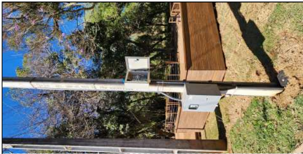
14 | entrada de energia, iluminação