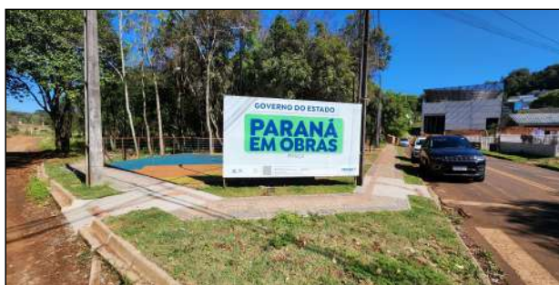
1 | Placa de obra