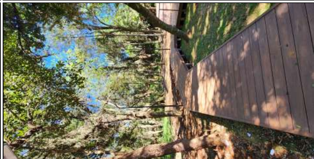
9 | deck de madeira plástica, grama, iluminação