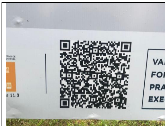
01.DETALHE DA PLACA DA OBRA (QRCODE)