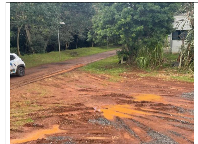
05. Remoção academia dos idosos