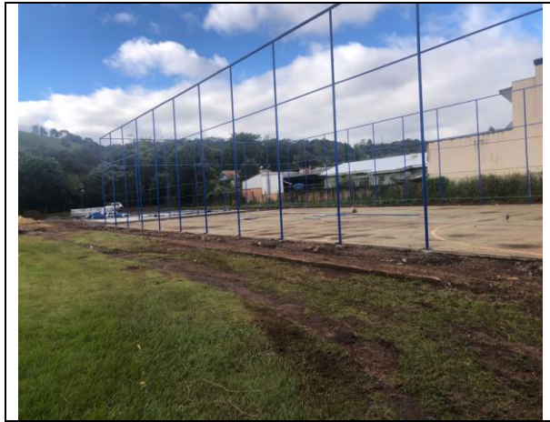
09. Quadra poliesportiva