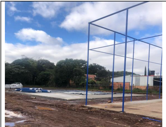
10. Quadra poliesportiva