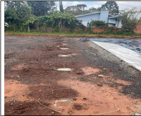
08. Estaca/Brocas e espera para alambrados