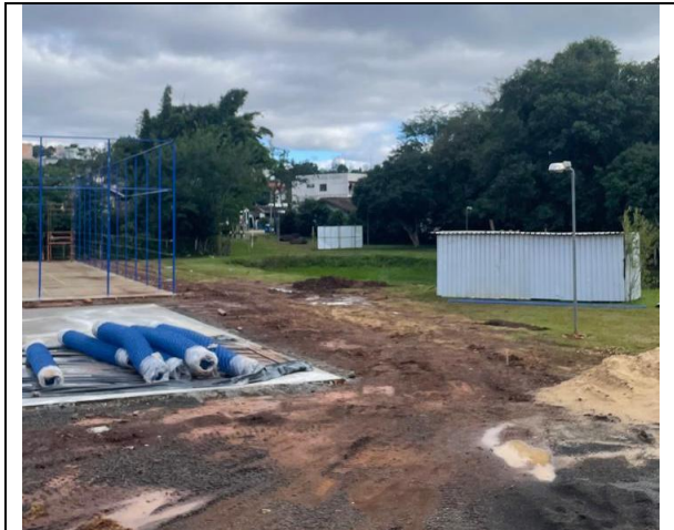
03. Execução de estacas e piso