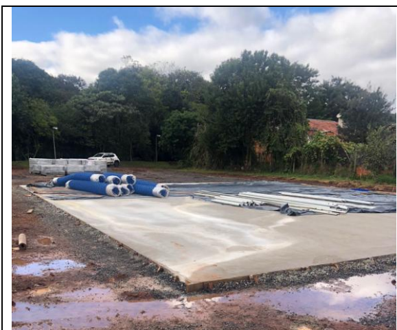
12. Piso quadra de basquete