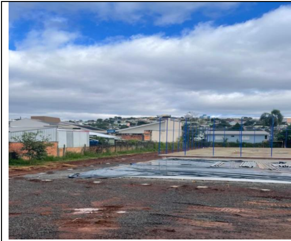
02. Estaca/Brocas e espera para alambrados