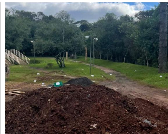
04. Demolição de pavimento asfáltico