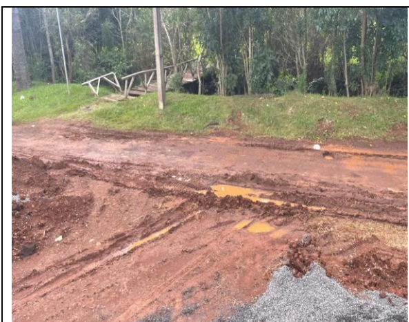
06. Terraplenagem e demolição de passeio