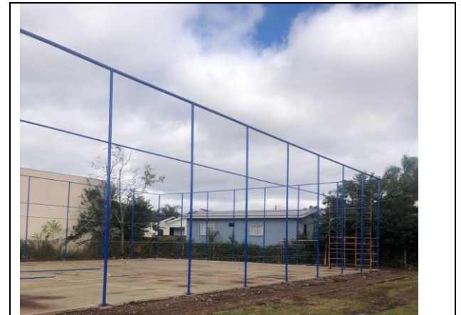
11. Quadra poliesportiva