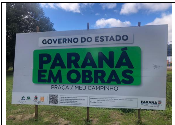
01.PLACA DA OBRA ATUALIZADA