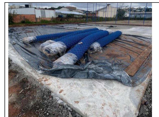
07. Piso de Concreto – quadra de basquete