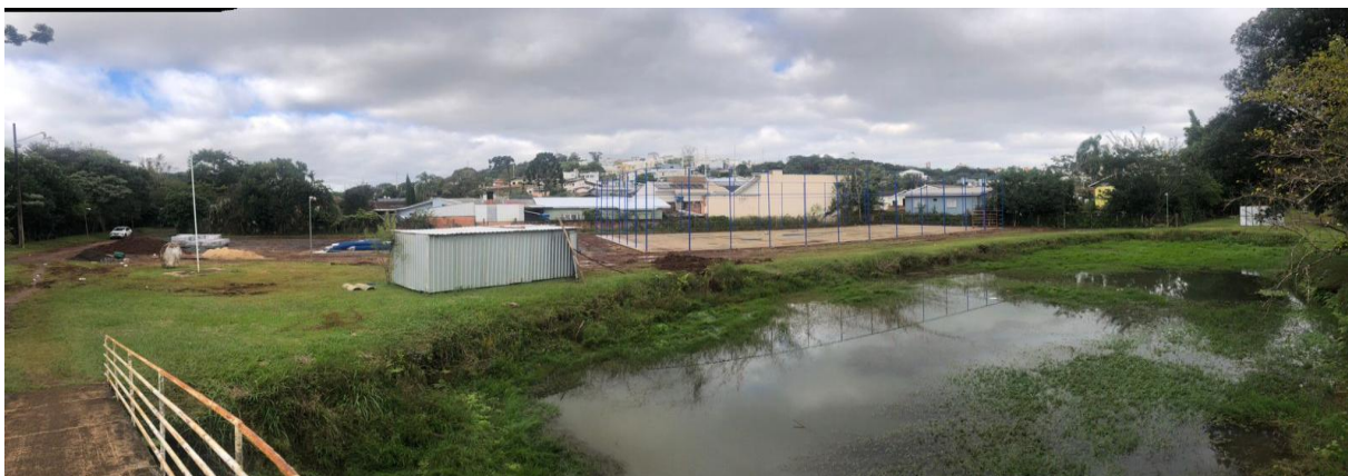
13. FOTO PANORÂMICA DA OBRA