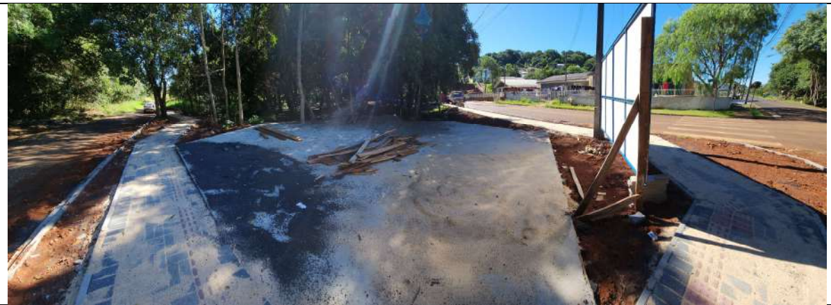
FOTO PANORÂMICA DA OBRA