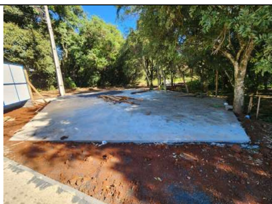
F7: execução de base de concreto