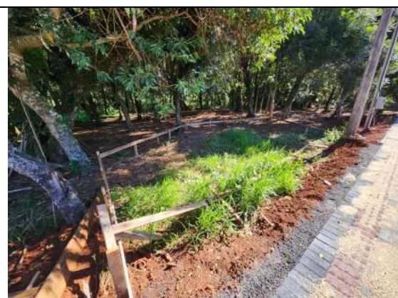
F8: locação do deck de madeira plástica