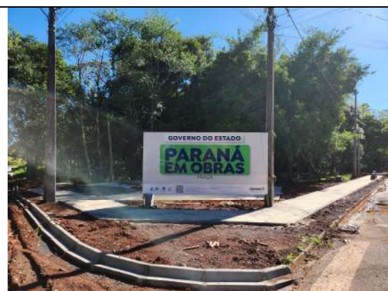
F6: execução de calçada de paver, fincadinha e meio fio