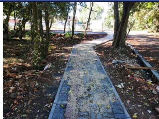
F4: execução de calçada em paver, fincadinha e meio fio