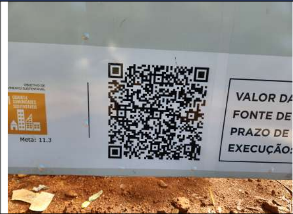
F2: DETALHE DA PLACA DA OBRA (QR CODE)