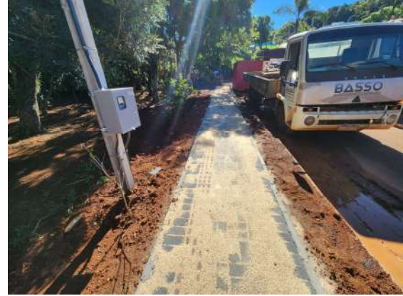
F10: execução de calçada de paver, escritório de obra