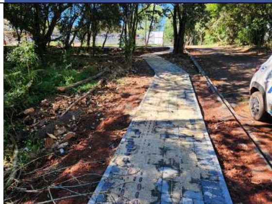
F3: execução de calçada de paver, fincadinha e meio fio