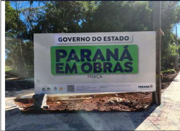
F1: PLACA DA OBRA ATUALIZADA