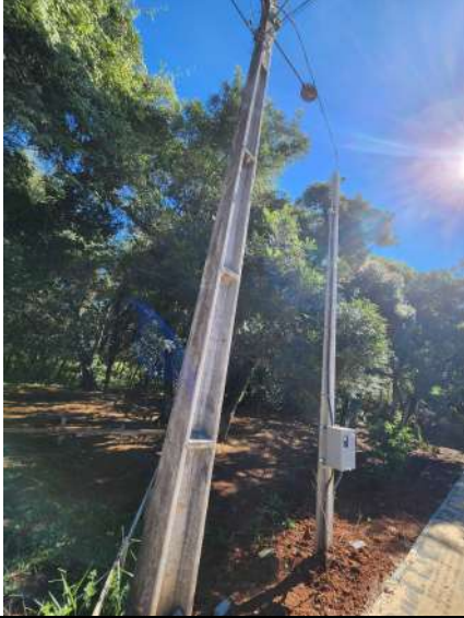
F9: entrada de energia