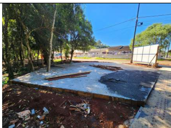
F5: execução de calçada em paver, execução de base de concreto