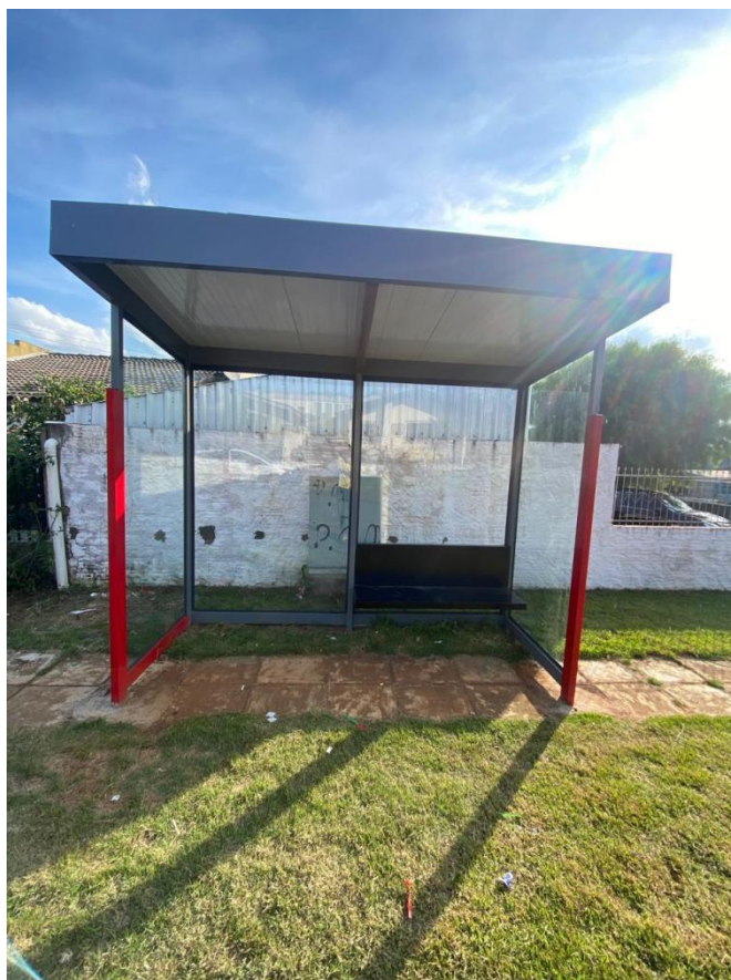
Rua Lupicínio Rodrigues, nº 160 - Bairro Morumbi.