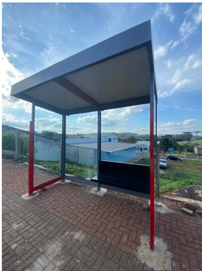
Rua Marília, nº 843 - Bairro São Roque.