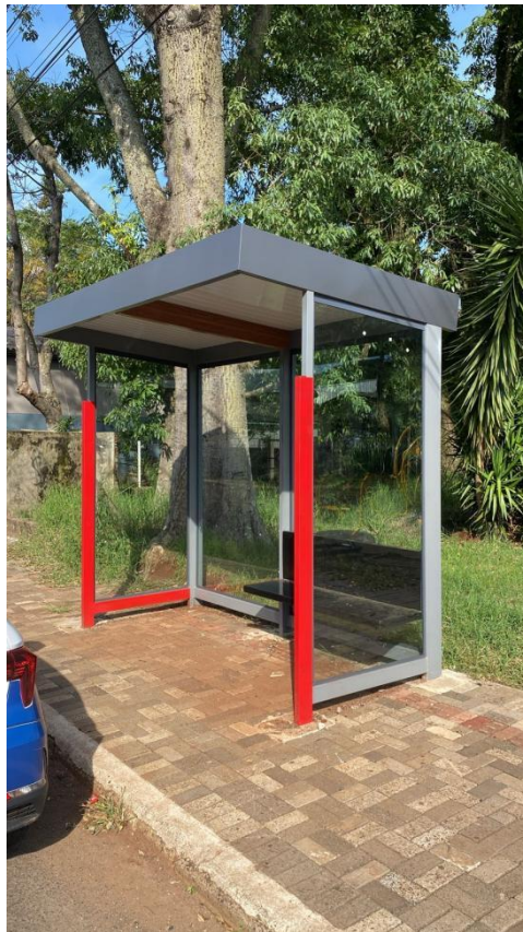
Rua Industrial, nº 177 - Bairro Industrial.

Foi efetuada a vistoria da obra, a fim de realizar a primeira medição, constatando a execução dos itens existentes na planilha de medição. Seguem fotos da obra: