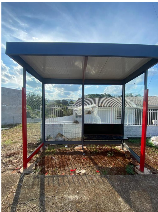
Rua Lupicínio Rodrigues, nº 649 - Bairro Morumbi.