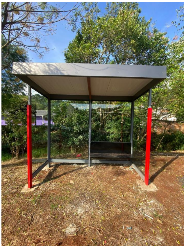
Rua Altamira, nº 930 - Bairro Bonatto.