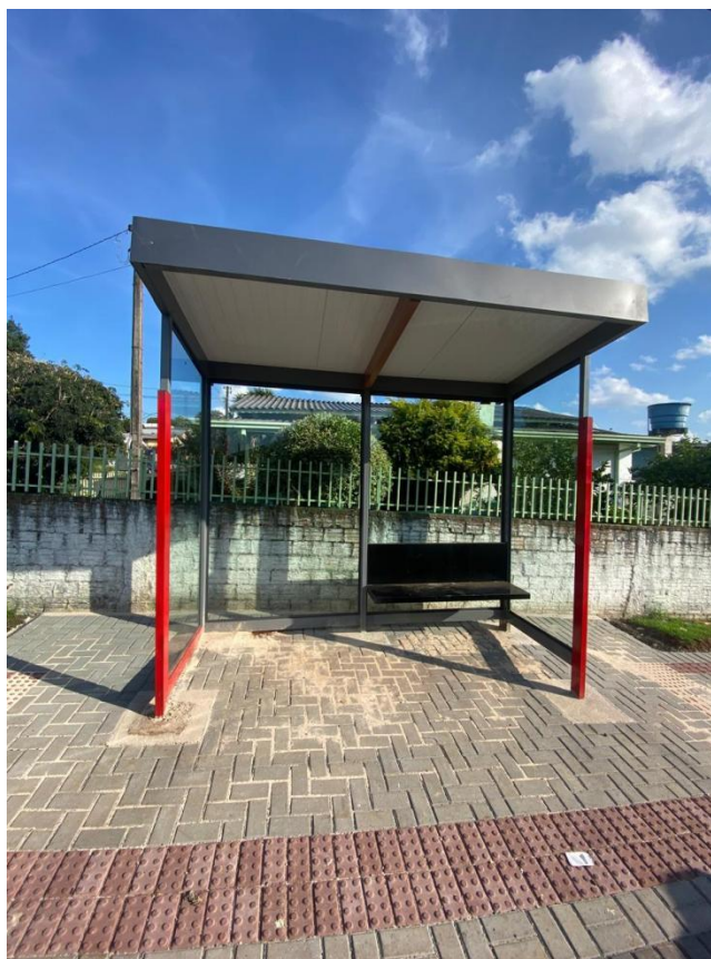
Rua Xavier, nº 146 - Bairro Pinheirinho.