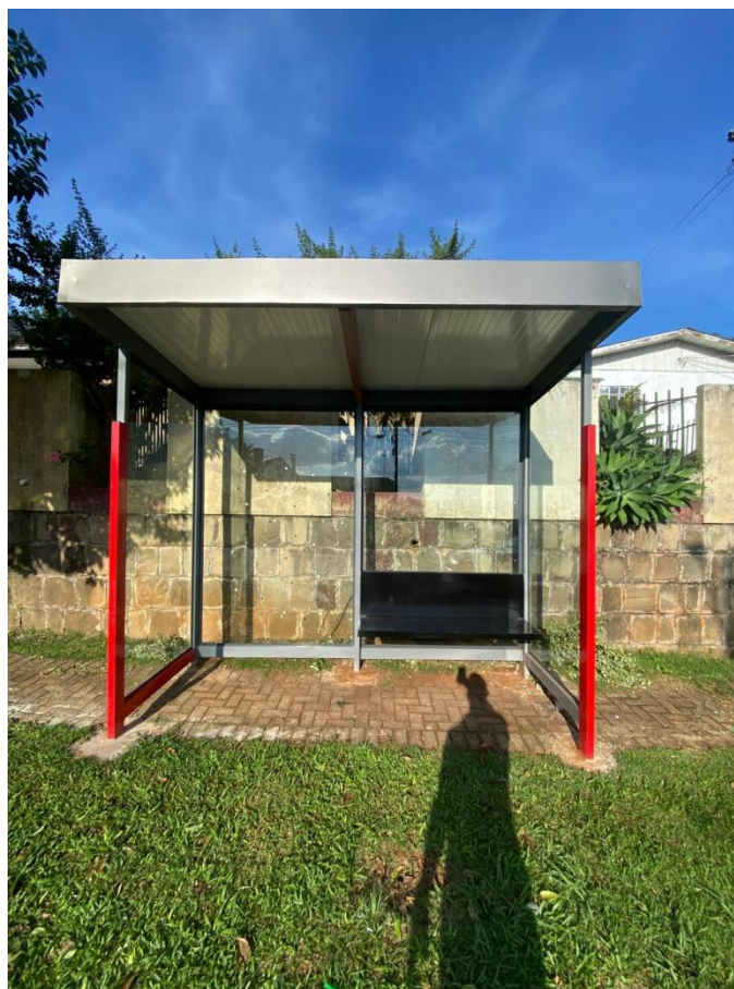
Rua Iguatemi, nº 202 - Bairro Pinheirinho.

Conforme ATA, a contratada deverá garantir a qualidade dos serviços prestados. Se, durante o recebimento definitivo, for constatado que os materiais foram entregues de forma incompleta, com qualidade e quantidade inferior à contratada, apresentando defeitos ou em desacordo com as especificações da aquisição, a Contratada se obriga a substituir os bens em desacordo ou entregar os bens remanescentes às suas expensas, após a notificação da Contratada, sendo interrompido o prazo de recebimento definitivo até que seja sanada a situação. A Contratada deverá reparar, corrigir, remover, reconstituir ou substituir, às suas expensas, os materiais que forem rejeitados, parcial ou totalmente, por apresentarem vícios, defeitos ou incorreções, em um prazo máximo de 10 (dez) dias .